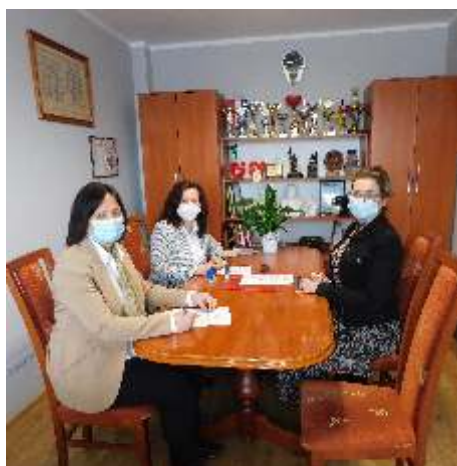
Podpisanie umowy z Prezesem Stowarzyszenia Cool - Tur

W dniach 4 i 5 marca 2021 r. Wójt Gminy Perzów, przy kontrasygnacie Skarbnika Gminy podpisał umowy na wsparcie realizacji zadań publicznych dla organizacji pozarządowych działających na terenie gminy Perzów z Prezesami stowarzyszeń, które otrzymały wsparcie finansowe na tegoroczne działania. Do otwartego konkursu ofert przystąpiło łącznie 5 organizacji, które po przeprowadzeniu procedury konkursowej otrzymały dofinansowania na zadania określone w złożonych ofertach. W budżecie gminy na 2021 r. zabezpieczono na ten cel 77000,00 zł.