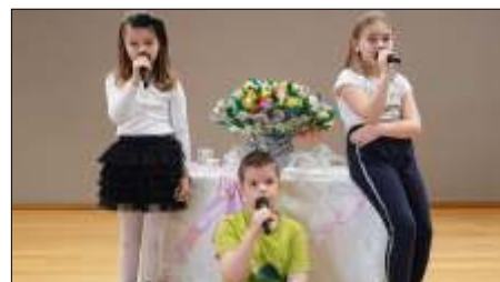
Dzie Kobiet w GOK czytaj na stronie 5 >>