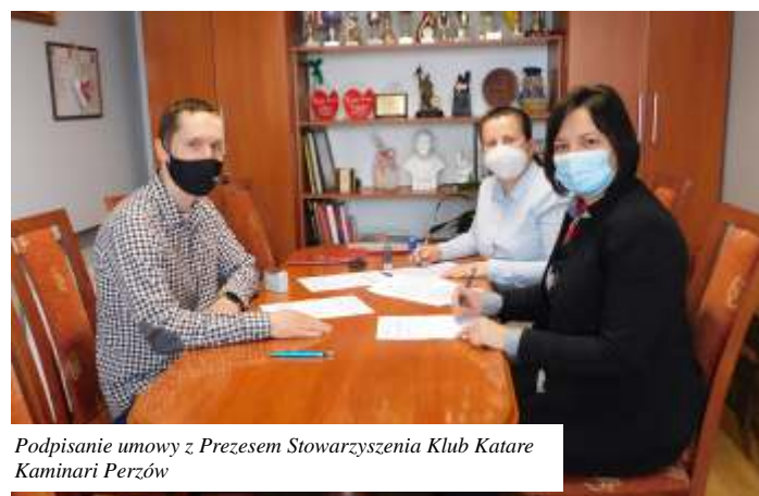
Podpisanie umowy z Prezesem Stowarzyszenia Klub Karate Kaminari Perzów