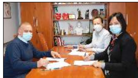
Dofinansowano organizacje pozarz dowe czytaj na stronie 3 >>