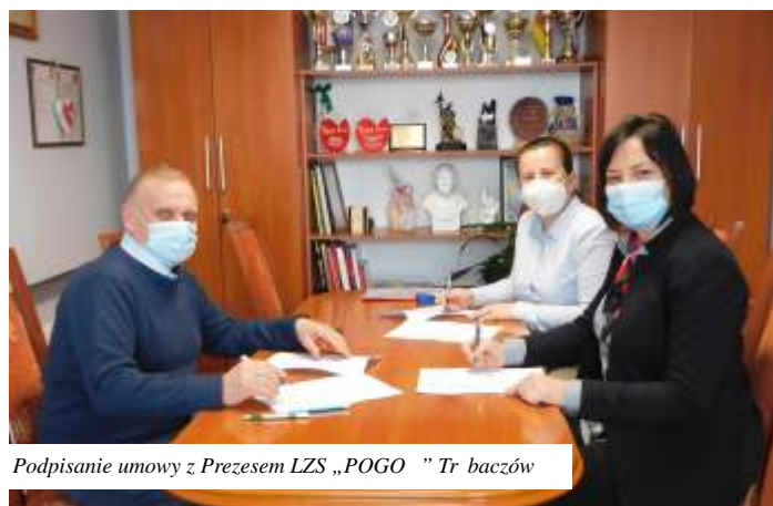
Podpisanie umowy z Prezesem LZS „POGO” Trzeczów