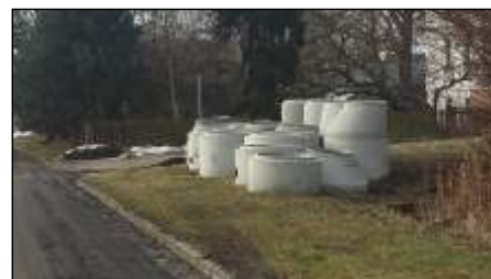
Trwaj budowy kanalizacji sanitarnych czytaj na stronie 4 >>