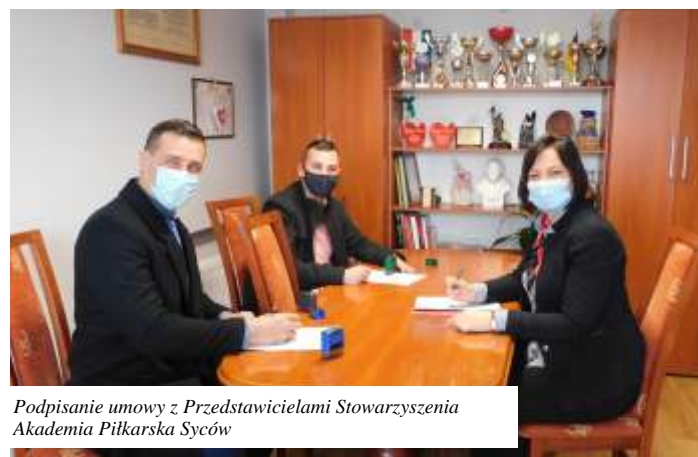
Podpisanie umowy z Przedstawicielami Stowarzyszenia Akademia Piłkarska Syców