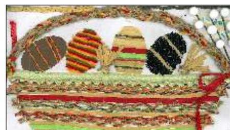
Rozstrzygni to konkurs na kartk wielkanoc czytaj na stronie 6 >>