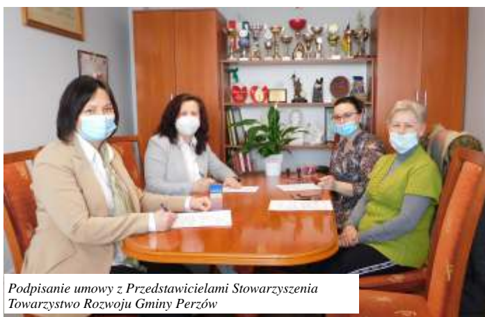
Podpisanie umowy z Przedstawicielami Stowarzyszenia Towarzystwo Rozwoju Gminy Perzów