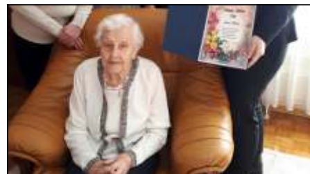
Spotkanie z najstarszymi mieszkańcami Gminy czytaj na stronie 4 >>