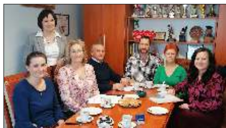
Podpisano umowy z organizacjami poza gminnymi czytaj na stronie 4 >>