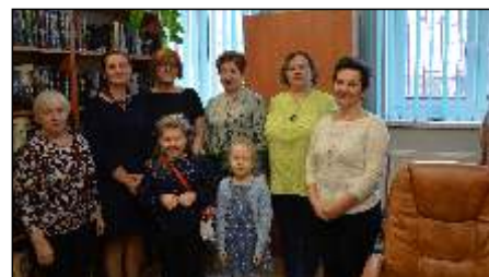
Czytelnik roku 2019 czytaj na stronie 74 >>